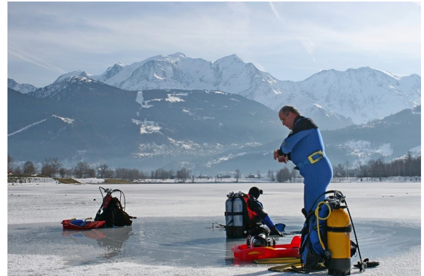
Rencontre de photographes subaquatiques